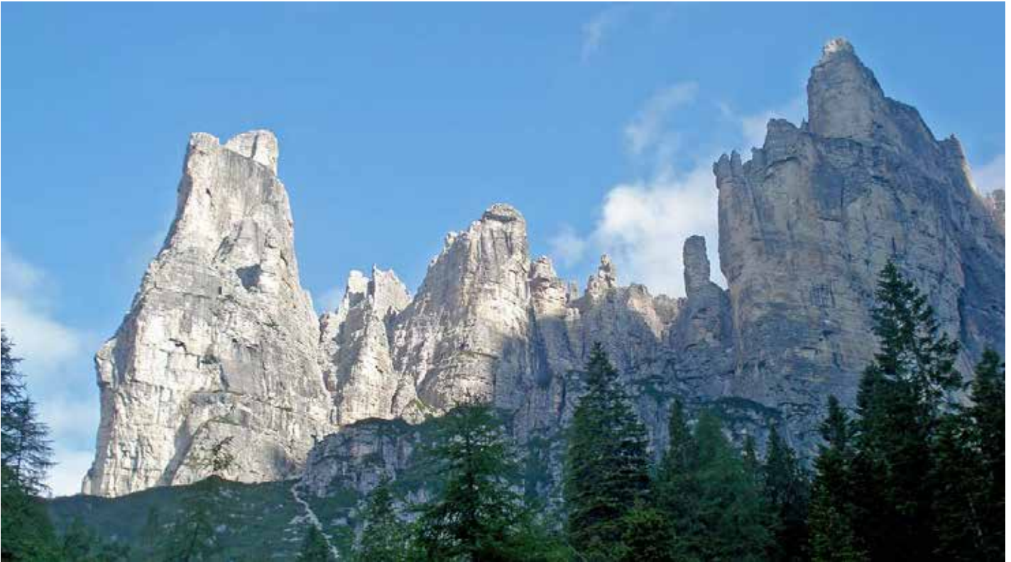
Die Felswände der Moiazza

Von Hütte zu Hütte wandern – dort, wo die Dolomiten am schönsten sind!