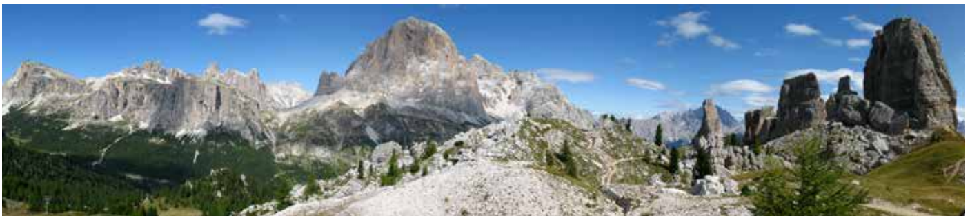
Die Tofanen mit den Cinque Torri