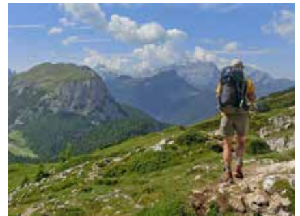
Blick auf die Civetta