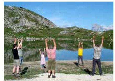
Am Lago Coldai