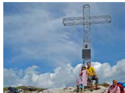
Oberhalb des Rifugio Tissi