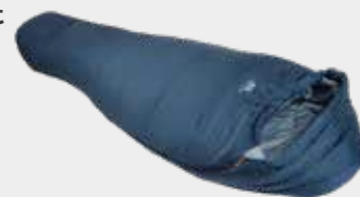
Kunstfaserschlafsack Lunar 1

Schlafsäcke können über Clearskies bestellt werden!