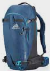
Targhee 32 L