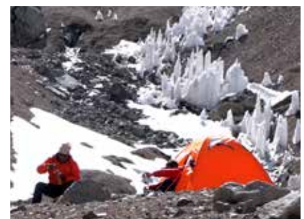
Das in den Anden häufig auftretende Büßereis