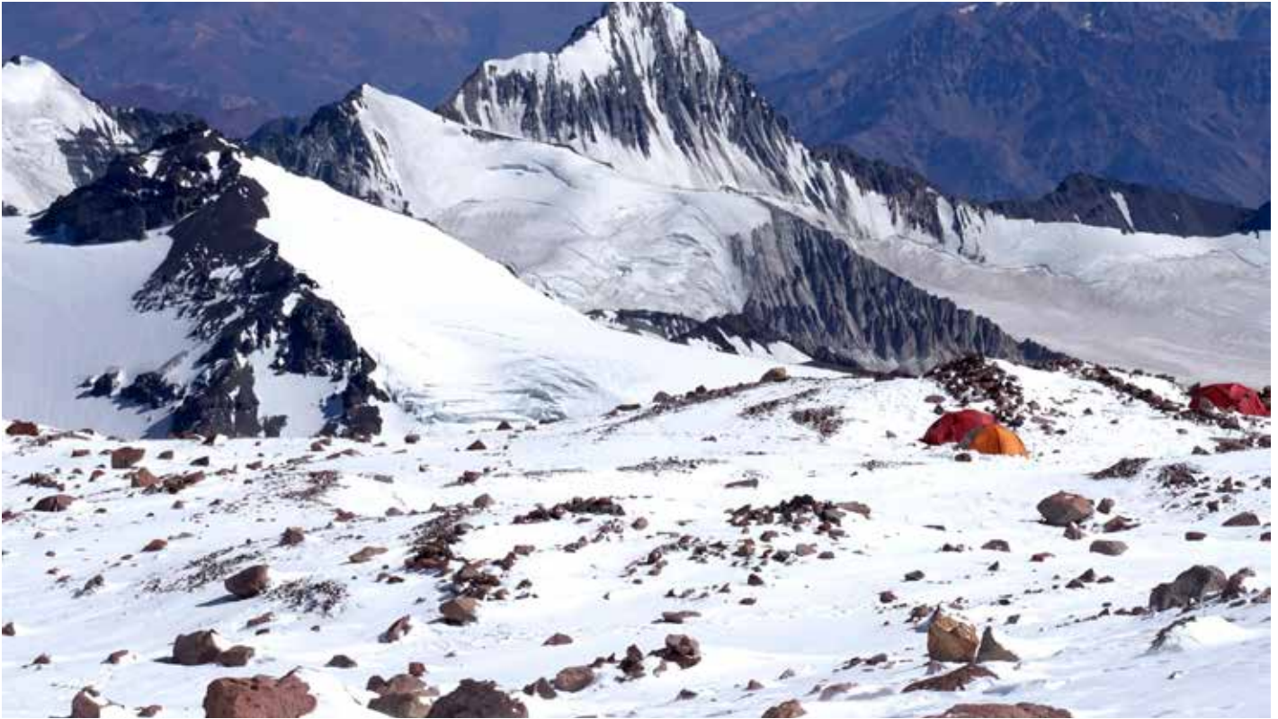
Hochlager am Aconcagua