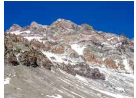
Westflanke des Aconcagua

Am 15.12.2014 trat das GeoControl Schutzprogramm für Bankomatkarten in Kraft. Für Bargeldbehebung außerhalb Europas muss Ihre Bankomatkarte daher freigeschaltet werden! Bitte nehmen Sie Kontakt mit Ihrer Bank auf und lassen Sie Ihre Bankomatkarte freischalten, wenn Sie diese im Ausland verwenden möchten.