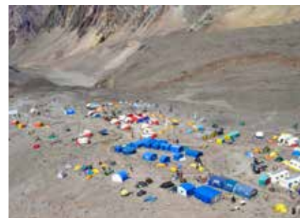
Basislager Plaza de Mulas

Höhenmedizin: Wir raten stark von der prophylaktischen Einnahme von Medikamenten gegen Höhenkrankheit (Diamox) ab. Die Warnsignale, die der Körper gegebenenfalls sendet, sind ernst zu nehmen und sollten nicht medikamentös unterdrückt werden.