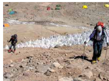
Im Aufstieg vorbei am Büßereis