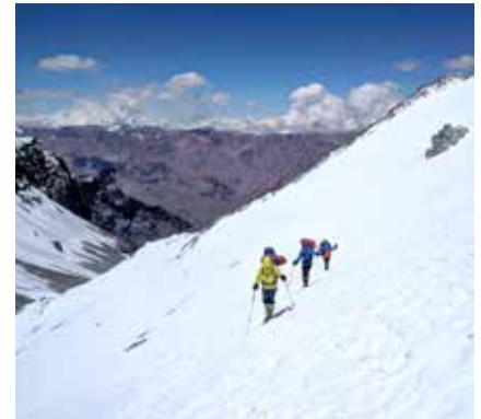
Polentraverse bei Schnee

Je nach Gruppengröße werden zusätzliche einheimische (englischsprachiger) Bergführer (IVBV / UIAGM) die Gruppe begleiten und unterstützen. So können wir eine optimale Betreuung garantieren und flexibel auf etwaige Eventualitäten eingehen.