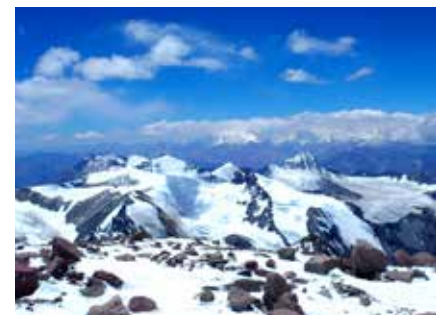
Blick vom Gipfel des Aconcagua