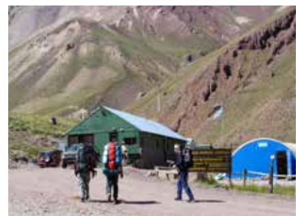
Beim Eingang zum Nationalpark des Aconcagua