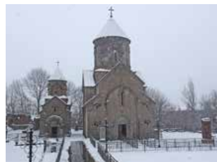
Kirche bei Teghenis