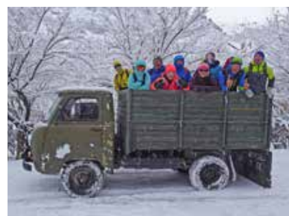
Improvisierter Transport zur Skitour