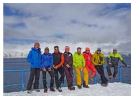
Am großen Sewansee