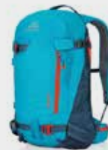
Targhee 26 L