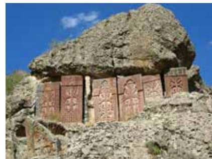
Kreuzsteine beim Kloster geghard