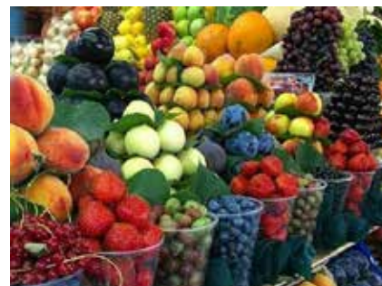
Am Markt in Jerewan