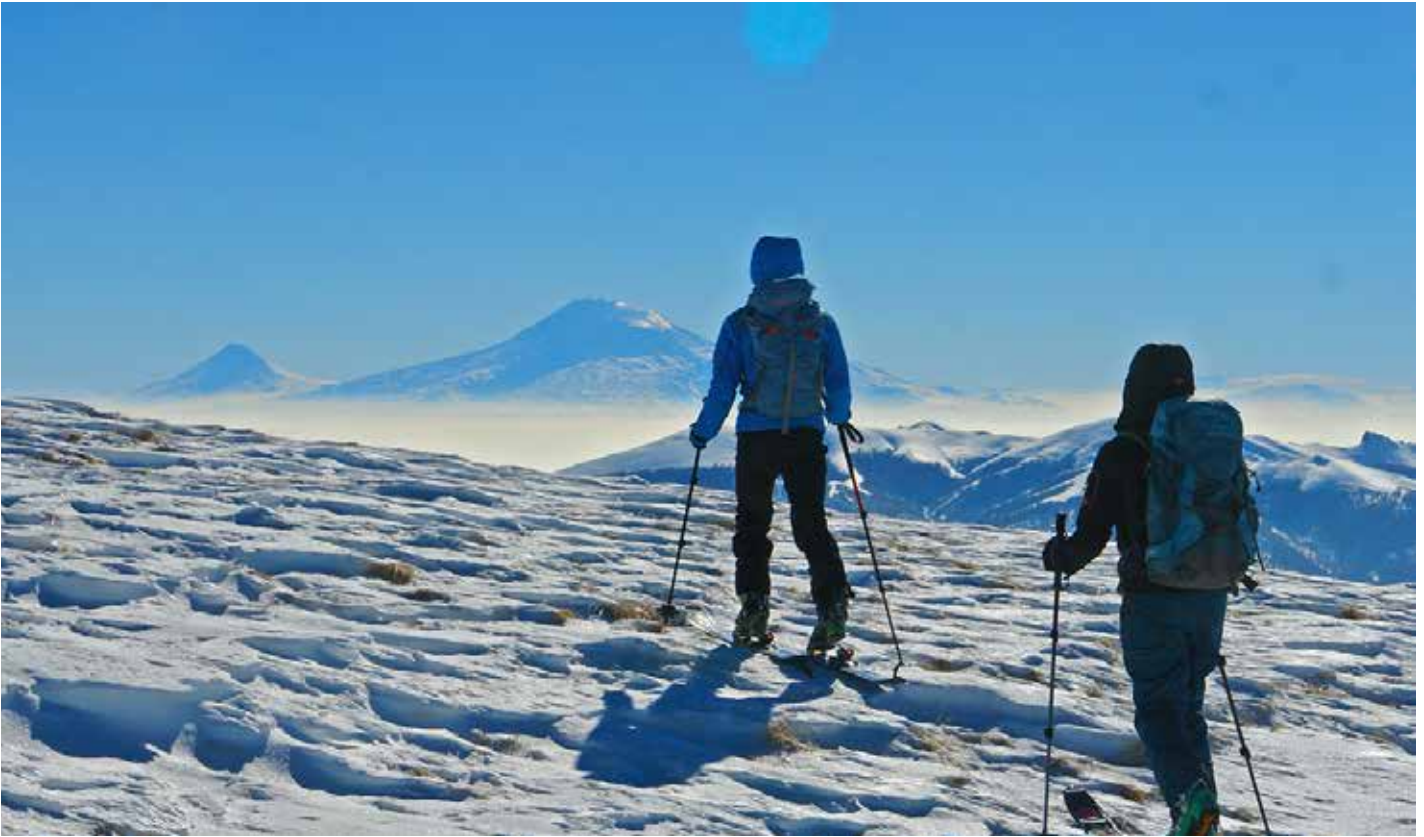
Blick auf den Ararat