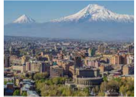
Jerewan und der heilige Berg Ararat