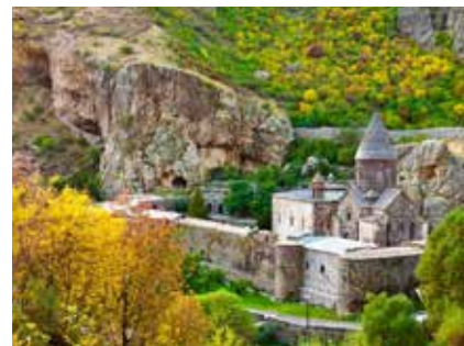
Das Kloster Geghard

Der Reisepass muss mindestens sechs Monate nach Ausreise gültig sein.