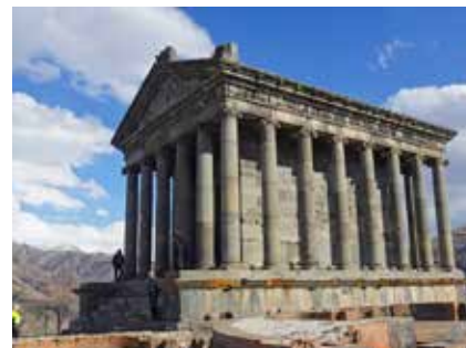
Der hellenistische Tempel von Garni

Für die Einreise nach Armenien sind keine Impfungen vorgeschrieben. Empfehlenswert sind, wie bei den meisten Fernreisen, Impfungen gegen Tetanus, Diphtherie, Polio, Typhus und Hepatitis A und B. Malariaphylaxe benötigt man nur im Süden des Landes. In die Reiseapotheke gehören jedenfalls Medikamente gegen Durchfall, Antibiotika, Lotion gegen Insekten, Sonnenschutzmittel und Verbandszeug. Beachten Sie bitte, dass die medizinische Versorgung in Georgien nicht dem westlichen Standard entspricht und berücksichtigen Sie das bitte bei Ihrem Versicherungsschutz für die Reise. Bitte lassen Sie sich in jedem Fall von Ihrem Arzt beraten.