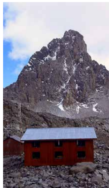
Austrian Hut mit Nelion