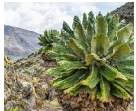
Senecien im Mount Kenya Nationalpark

Mobiltelefone: Am Berg gibt es keinen bzw. kaum Empfang. Während der Tour gibt es keine Möglichkeiten, Fotoapparate oder Mobiltelefone aufzuladen. Wir empfehlen daher die Mitnahme von Zusatzakkus bzw. Powerbanks.