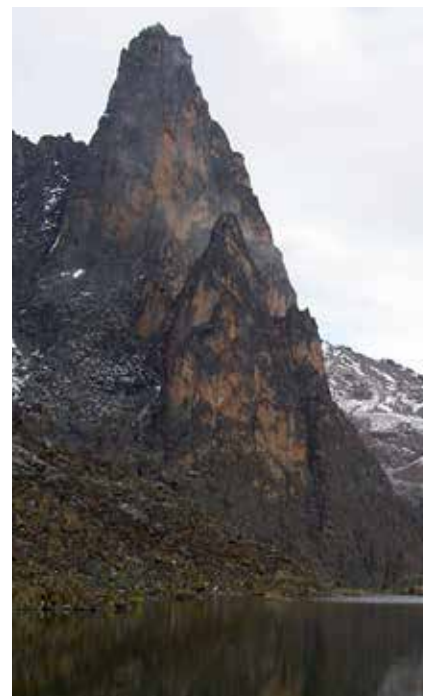
Der Midget Peak im Mt. Kenya Massiv