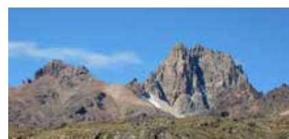
Pt. Lenana (links) mit Nelion und Batian