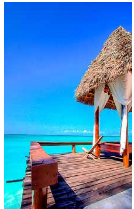
Optionale Erholungsverlängerung in Sansibar

Kreditkartenzahlung: Die Bezahlung Ihrer Reise mit Kreditkarte ist prinzipiell möglich. Bitte beachten Sie, dass hier teilweise Spesen entstehen können. Bitte kontaktieren Sie uns diesbezüglich telefonisch.