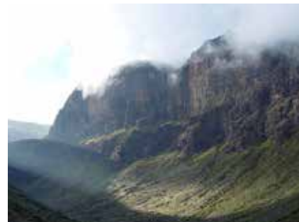
Im Mount Kenya Nationalpark

Am Berg werden Sie ansonsten kaum Geld brauchen, ein paar einzelne Dollars (10 – 20) bzw. Kenianische Shillings sind aber immer gut in der Tasche zu haben.