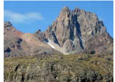
Der Batian – zweithöchster Gipfel Afrikas

Bitte beachten Sie, dass die Mentalität in Kenia nicht mit unseren westlichen Standards verglichen werden kann. Die Gesellschaft ist nicht so leistungsorientiert, das Heute ist wichtiger als das Morgen und auch Pünktlichkeit und genaue Planung haben einen weniger großen Stellenwert. „Die Uhren laufen langsamer“. Wir erwarten von unseren Mitreisenden Offenheit und Toleranz gegenüber der fremden Kultur und auch etwas Gelassenheit, falls die zeitlichen Abläufe in Kenia nicht den europäischen Vorstellungen entsprechen, bzw. schwer nachvollziehbar sind. Die Etappen sind mit ausreichenden Zeitpuffern geplant und Sie werden Ihr Tagesprogramm problemlos erfüllen können, auch wenn z. B. die Registrierung am Gate einmal längere Zeit in Anspruch nimmt.