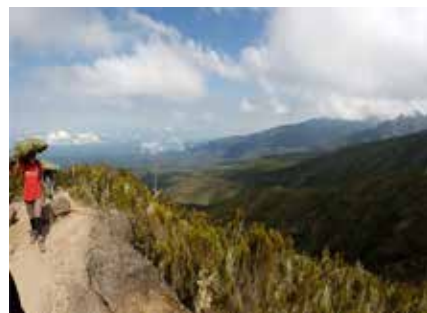
Ausblick auf die Heidewälder

In Tansania gibt es zwei Trockenzeiten: die „warme“ von Mitte Dezember bis Mitte März und die „kühlere“ von Anfang Juli bis Mitte Oktober, die von 2 Regenzeiten unterbrochen werden, nämlich der „großen“ Regenzeit von April bis Juni und der „kleinen“ Regenzeit von Oktober bis Anfang Dezember. Die Hochsaison für Safarireisen liegt im Juli und im August während der Migration der Tiere. Die besten Bedingungen für Bergbesteigungen findet man während den beiden Trockenzeiten, da die Sicht auf den Kibo in diesen Perioden meistens frei ist. Dies sind jedoch auch die am höchsten frequentierten Zeiten für Gipfelbesteigungen. Vergleichsweise ruhig ist es dagegen im Juni, Oktober und März.