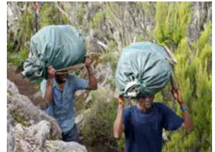
Porters am Kilimanjaro