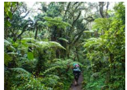
Aufstieg im Regenwald