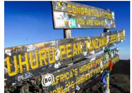
Am höchsten Punkt Afrikas