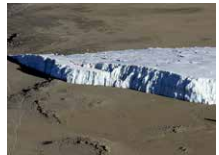
Gletscher im Krater