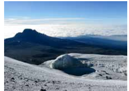
Crater Rim Gletscher am Kilimanjaro