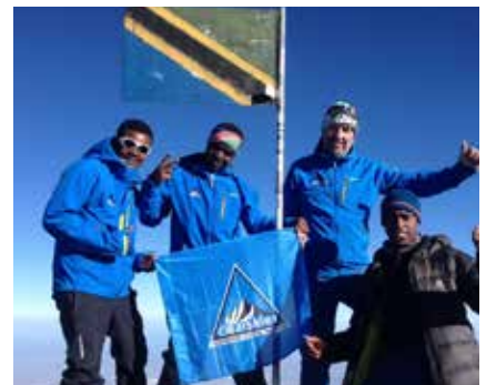
Bis bald in Tansania !