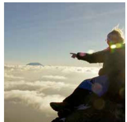
Blick auf den Kilimanjaro