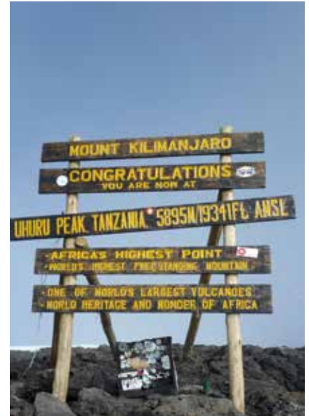
Der Uhuru Peak - höchster Punkt Afrikas

Sie können das Visum auch direkt am Flughafen ausstellen zu lassen. Aufgrund neuer Einreisebestimmungen kann dies jedoch etwas Stunden dauern.