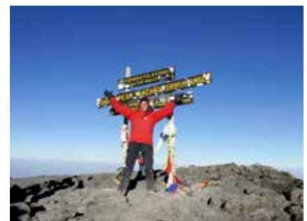
Am höchsten Punkt Afrikas