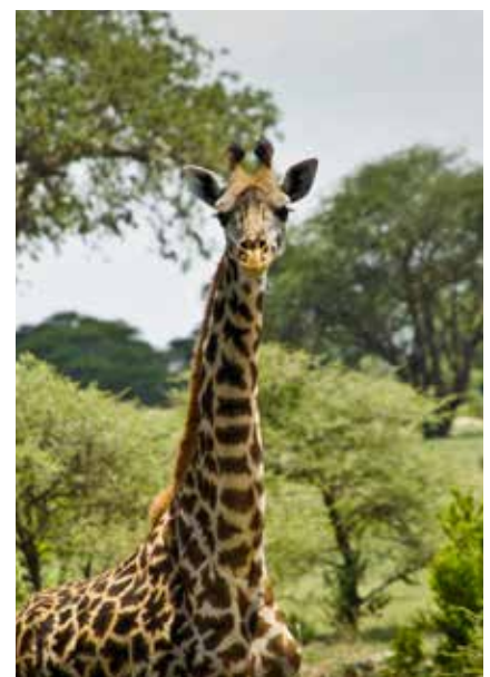
Giraffe im Lake Manyara Nationalpark