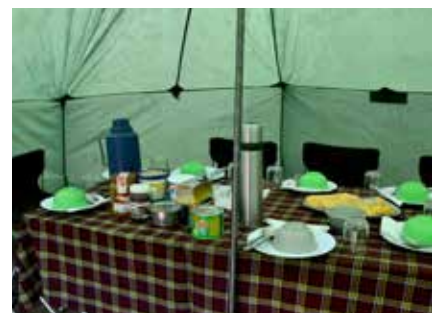
Frühstückstisch am Kilimanjaro