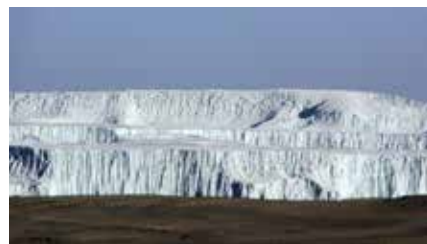
Gletscher im Krater