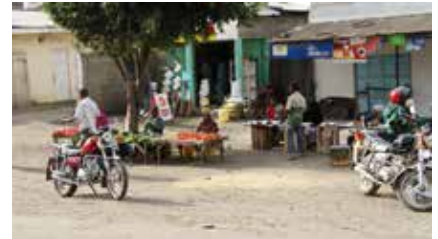
Marktstände entlang der Straße