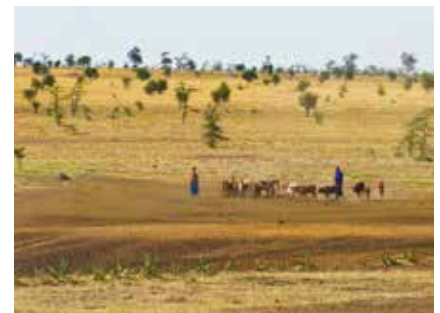
Massai Familie mit Ihren Rindern