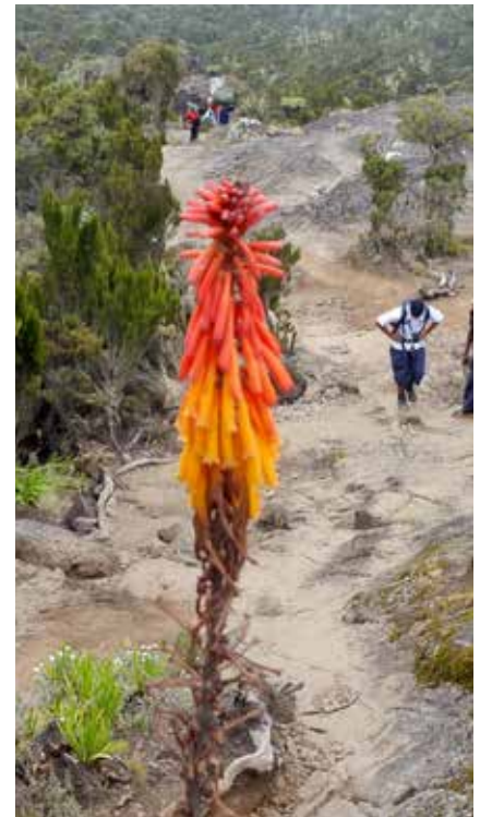
Durch die Heidewälder am Kilimanjaro

Die Ausfuhr der Landeswährung ist verboten, die Mitnahme von Fremdwährung ist bis zum bei der Einreise deklarierten Betrag erlaubt. Keine Beschränkungen sind hinsichtlich Waren bekannt. Die Ausfuhr von Gegenständen, die aus dem Material geschützter Tiere hergestellt sind und nicht den Vorschriften des Washingtoner Artenschutzabkommen entsprechen, ist verboten.