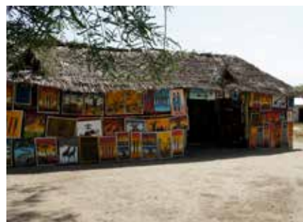
Art-Shop bei Moshi

Falls eine Gelbfiebersimpfung kontrolliert wird, zeigen Sie bitte ihr Flugticket vor, auf dem ersichtlich ist, dass Sie nur einen Transit-Aufenthalt unter 12 Stunden hatten.