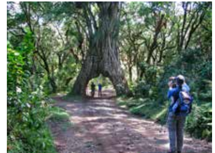
Fig Tree Arch im Arusha Nationalpark

Ein faszinierendes Naturschauspiel spielt sich alljährlich in der Serengeti ab: rund 1,2 Millionen Gnus, sowie 200.000 Zebras und 400.000 Gazellen, Topis und Antilopen, wandern in riesigen Herden, getrieben von der Suche nach nahrhaften Gräsern und legen dabei jährlich ca. 3.000 Kilometer zurück, wobei sie von Raubtieren gejagt werden.