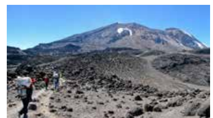
Am Shira Plateau