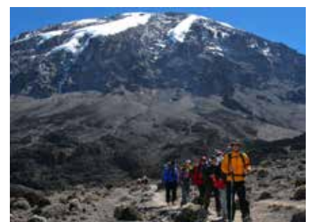
Aufstieg über die Machame Route