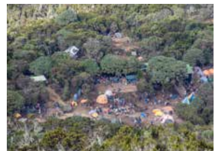
Mweka Camp beim Abstieg