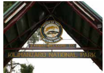
Beim Rongai Gate