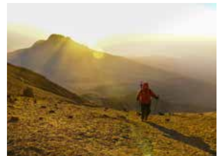
Sonnenaufgang über dem Mawanzi