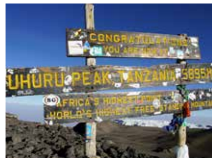
Gipfel des Kibo