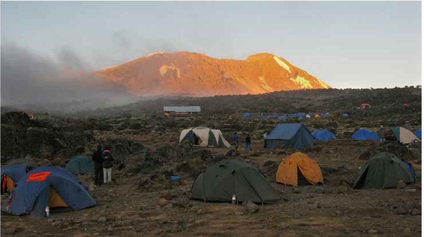
Blick vom Shira Plateau auf den Uhuru Peak (Machame Route)