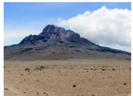
Blick auf den Mawenzi

Es gibt meist eine Suppe und anschließend ein Hauptgericht mit Reis, Nudeln, Kartoffeln oder Eiern in verschiedensten Variationen. Fleisch gibt es aufgrund der fehlenden Kühlkette meist nur während der ersten Tage.