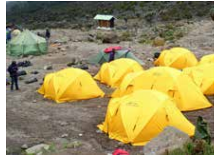
Zeltlager am Kili

Kreditkartenzahlung: Die Bezahlung Ihrer Reise mit Kreditkarte ist prinzipiell möglich. Bitte beachten Sie, dass hier teilweise Spesen entstehen können. Bitte kontaktieren Sie uns diesbezüglich telefonisch.