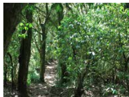
Im dichten Regenwald