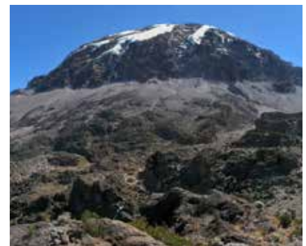
Der Kibo vom Karanga Valley