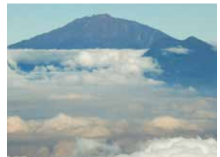
Blick auf den Mt. Meru