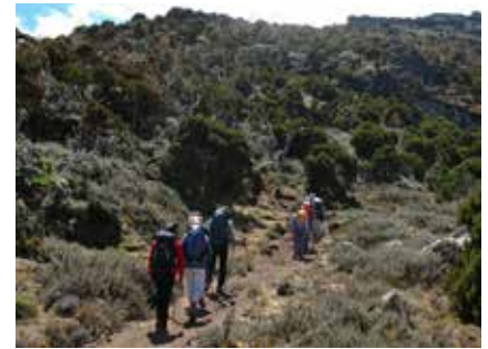
Aufstieg durch Heidwälder zum Shira Plateau

Nach der Gipfelrast steigt man wieder zum Barafu Camp ab, wo man sich nach den Strapazen erholen kann und ein frühes Mittagessen erhält. Anschließend wird zum letzten Lager für die Übernachtung weiter abgestiegen.