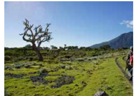
Aufstieg zur Miriakamba Hut (Mt. Meru)