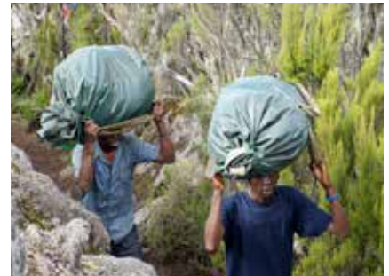
Porters am Kilimanjaro