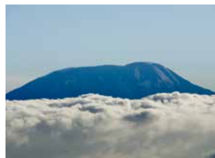
Kilimanjaro vom Mt. Meru gesehen.