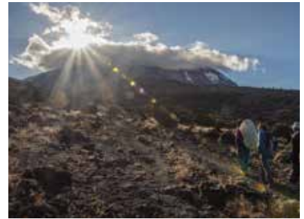
Vom Machame zum Shira Camp

Mobiltelefone: Am Berg gibt es immer wieder Empfang (Roaming). Ihr Guide wird Ihnen auf Anfrage die entsprechenden Plätze gerne zeigen. Während der Tour gibt es keine Möglichkeiten, Fotoapparate oder Mobiltelefone aufzuladen. Wir empfehlen daher die Mitnahme von Zusatzakkus bzw. Powerbanks.