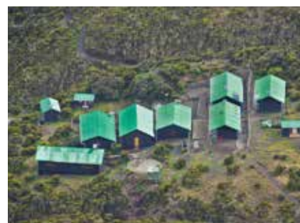
Blick auf die Saddle Hut (Mt. Meru)