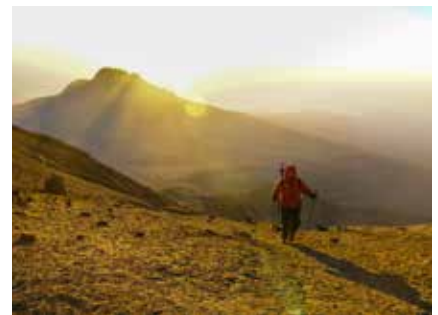
Sonnenaufgang über dem Mawanzi

Bei Sonnenaufgang erreicht man beim Stella Point den Kraterrand am Kilimanjaro. Nach kurzem Zwischenstopp werden noch die letzten Meter bis zum Uhuru Peak absolviert. Nach der Gipfelrast steigt man zum letzten Lager ab, wo man sich nach den Strapazen erholen kann und ein frühes Mittagessen erhält. Anschließend wird zum nächsten Lager für die Übernachtung weiter abgestiegen.