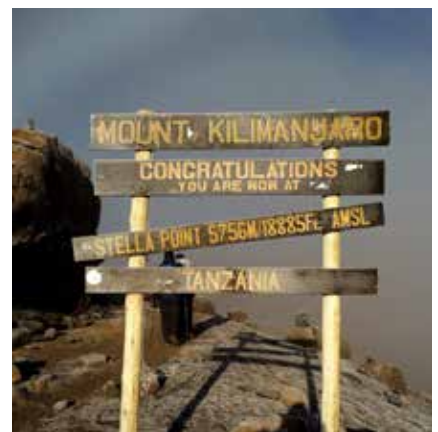
Stella Point am Kraterrand