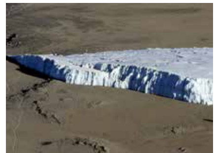
Gletschereis im Krater