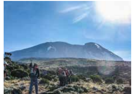
Blick auf den Kibo vom Shira Plateau