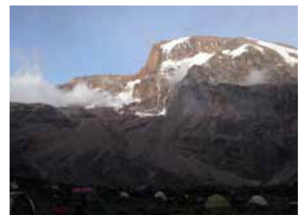
Blick vom Barranco Camp auf den Kibo