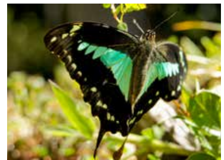
Im Arusha Nationalpark