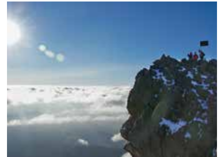
Am Mt. Meru

Im Abstieg kann man gut über Schotterreisen abkürzen. (Ein Tipp: Leichte Gamaschen schützen vor Steinen in den Schuhen).