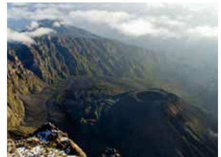
Blick vom Mt. Meru auf den Ashcone