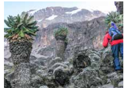
Durch die Barranco Wall

Um die Gefahr einer Höhenerkrankung zu minimieren ist ein langsames Ansteigen während der ersten Etappen notwendig. Unsere erfahrenen Guides geben Ihnen während des Aufstieges viele Tipps zur Akklimationisierung.