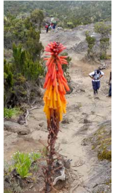
Durch die Heidewälder am Kilimanjaro

Die Ausfuhr der Landeswährung ist verboten, die Mitnahme von Fremdwährung ist bis zum bei der Einreise deklarierten Betrag erlaubt. Keine Beschränkungen sind hinsichtlich Waren bekannt. Die Ausfuhr von Gegenständen, die aus dem Material geschützter Tiere hergestellt sind und nicht den Vorschriften des Washingtoner Artenschutzabkommen entsprechen, ist verboten.