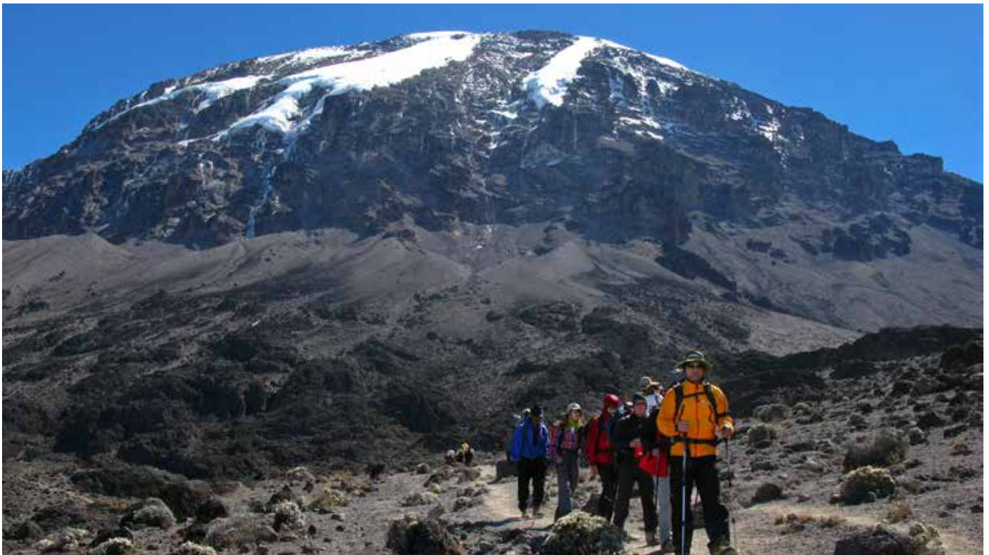
Auf dem Weg zum Karanga Camp - Kilimanjaro Machame Route