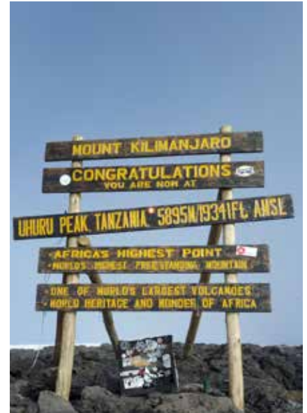
Der Uhuru Peak - höchster Punkt Afrikas

Sie können das Visum auch direkt am Flughafen ausstellen zu lassen. Aufgrund neuer Einreisebestimmungen kann dies jedoch etwas dauern.