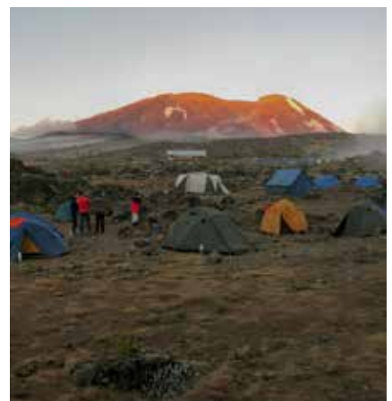
Sonnenuntergang am Shira Plateau