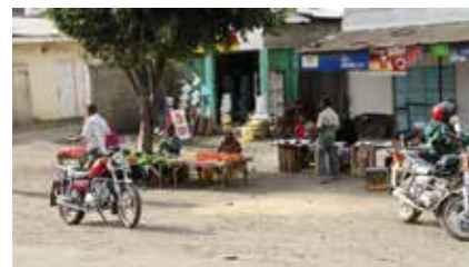
Marktstände entlang der Straße