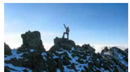
Am Mt. Meru