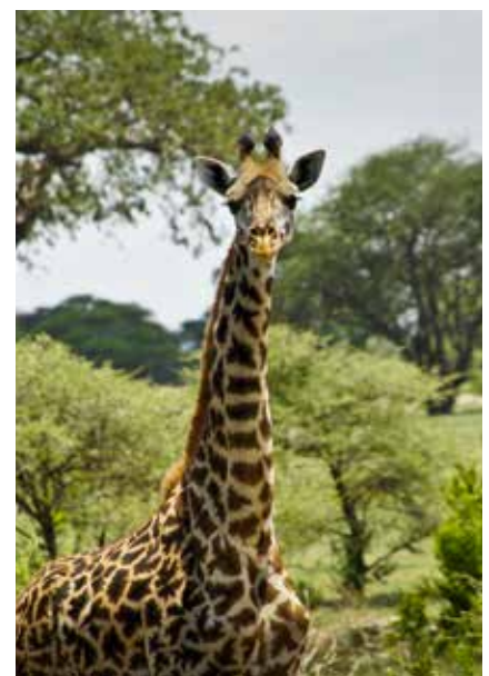
Giraffe im Lake Manyara Nationalpark