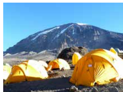
Zeltlager im Karanga Valley

Es gibt meist eine Suppe und anschließend ein Hauptgericht mit Reis, Nudeln, Kartoffeln oder Eiern in verschiedensten Variationen. Fleisch gibt es aufgrund der fehlenden Kühlkette meist nur die ersten Tage.