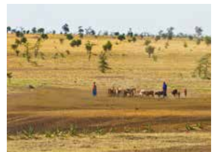
Massai Familie mit Ihren Rindern