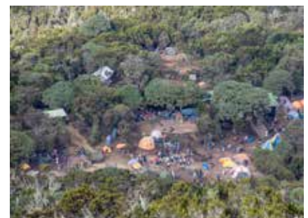
Mweka Camp am Kilimanjaro