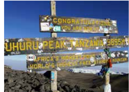
Gipfel des Kibo

Sehr gute Kondition ist erforderlich und wird vorausgesetzt.