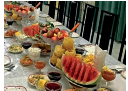
Festtafel im Homestay

Dank der prinzipiell niedrigen Luftfeuchtigkeit ist das Klima im Allgemeinen sehr gut verträglich. Die heißen Sommermonate Juli und August sind geradezu ideal, um die Bergwelt Kirgisiens zu bereisen. In den Bergtälern liegen die Durchschnittstemperaturen zwischen 20° und 25° C. Auf Höhen um 3000m findet man noch Tagestemperaturen um 15° C vor. Sobald allerdings die Sonne am späteren Nachmittag untergeht, frischt es auf, Nachttemperaturen um den Gefrierpunkt sind in Höhen um 3500 Meter nicht ungewöhnlich.