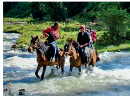
Flussquerung, Khirgiz Alatau

Der Personalausweis genügt zur Einreise nicht. Der Reisepass muss bei Einreise noch mindestens 6 Monate gültig sein.