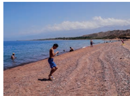
Am Strand des Issyk Kul