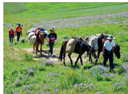
Pferdekarawane, hoher Tien Shan