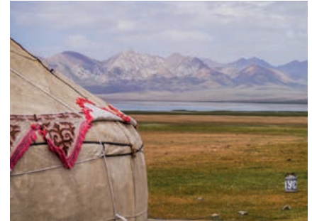
Der Son-Kul - das blaue Juwel der Nomaden