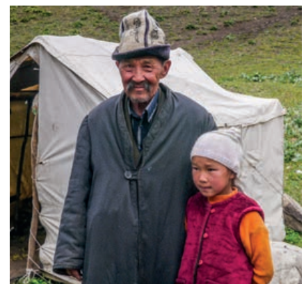
Großvater und Enkel im Jailoo