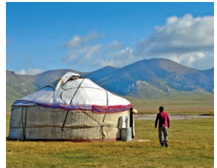
Die traditionellen kirgisischen Yurten

Aufstiege bis ca. 800 Höhenmeter am Tag, meist weniger. Abstiege bis ca. 800 Höhenmeter am Tag, meist weniger. Die Gehzeiten können bis zu 6 Stunden am Tag betragen, die meisten Etappen der Tour sind kürzer. Die zum Teil langen Distanzen von bis zu 15 Kilometer am Tag sollten nicht unterschätzt werden.