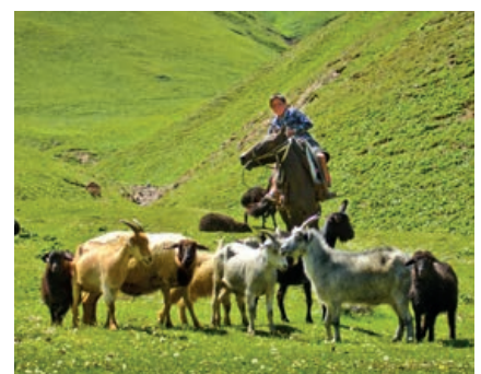
Schäferbub mit Herde