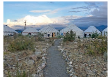
Yurtlager am Issyk Kul