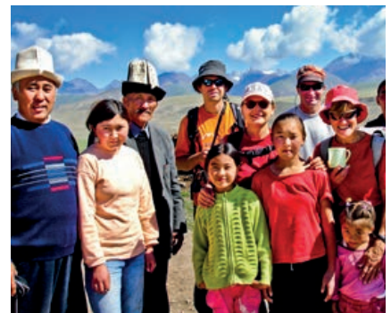
Austausch mit einer kirgisischen Nomadenfamilie

Aufbauend auf dem sowjetischen Erbe ist Kirgistan eine säkulare Republik. Selbst wenn sich ca. 70% der Bevölkerung dem sunnitischen Islam angehörig fühlen, spielt Religion in Kirgisien nach wie vor eine untergeordnete Rolle und es gibt keinen nennenswerten islamischen Fundamentalismus. Frauen haben in der Sowjetunion traditionell eine tragende Rolle in der Gesellschaft gespielt und entsprechend wichtige Posten in Administration, Wissenschaft und Wirtschaft bekleidet. Das Vermächtnis der Sowjetunion besteht heutzutage auch in einer starken und selbstbewussten Rolle der Frauen.