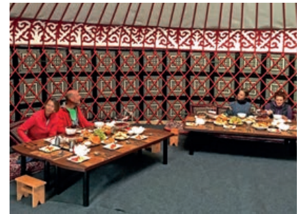
Kirgisischer Luxus in den Yurten