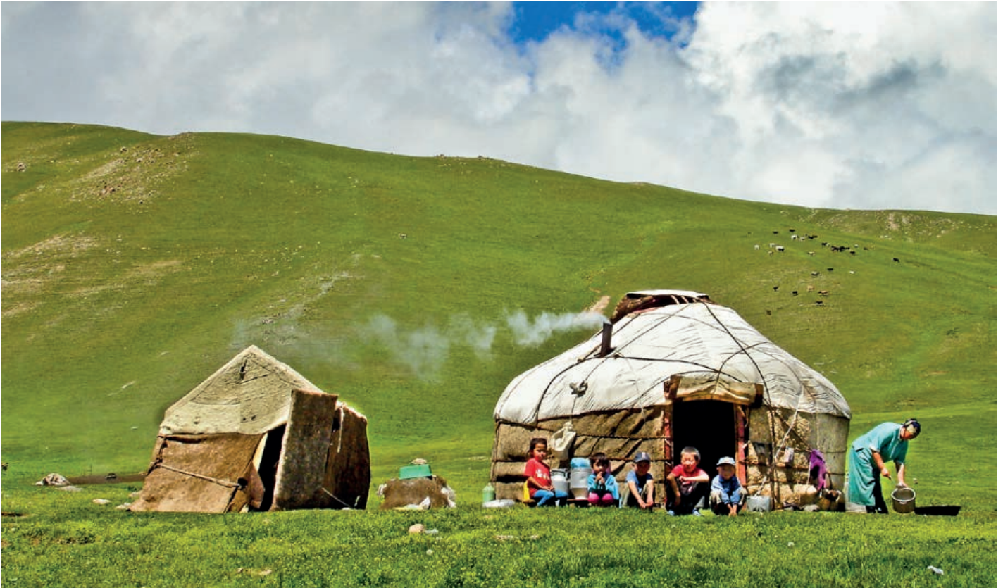
Nomadenlager im Khirgiz Alatau

Reise mit deiner Familie auf den Spuren der Nomaden durch Kirgistan