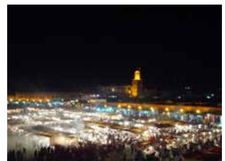
Der Djemma-el-Fna bei Nacht