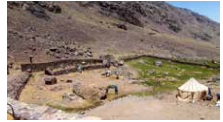
Unser Zeltplatz beim Toubkal-Basislager

Für die Einreise nach Marokko gibt es keine Visumpflicht. Ein Personalausweis genügt zur Einreise nicht. Der Reisepass muss bei Einreise noch mind. 6 Monate gültig sein.