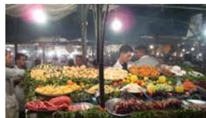
Marktstände mit frischen Speisen in Marrakesch

Ein warmer Schlafsack sowie eine aufblasbare Iso-Matte werden benötigt (siehe Ausrüstungsliste). Unsere Lagerplätze befinden sich meistens in unmittelbarer Nähe zu einem Bach, bzw. einer Wasserquelle, wo man sich im kalten Wasser waschen kann.