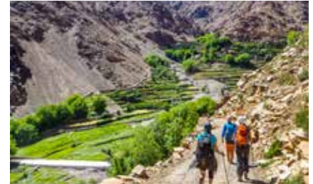
Abstieg vom Tizi'n Aguerzioual