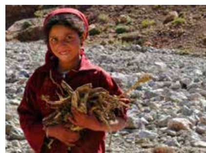
Berbermädchen beim Sammeln von Brennholz