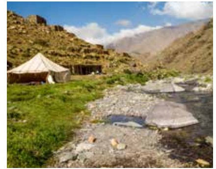
Idyllische Lagerstätte am Fluss

Zum Abendessen gibt es meist eine Suppe (Harira) und anschließend ein marokkanisches Hauptgericht mit Reis, Couscous, Kartoffeln oder Eiern in verschiedensten Variationen. Fleisch gibt es aufgrund der fehlenden Kühlkette nur während der ersten Tage. Der traditionelle Minztee darf natürlich bei keiner Mahlzeit fehlen.