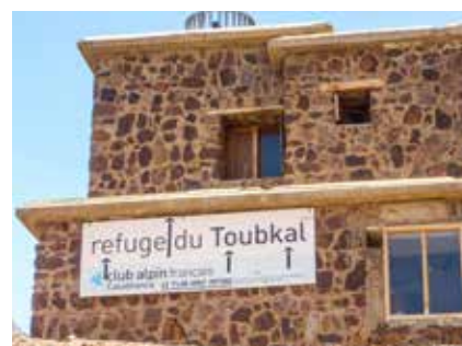
Hütte beim Toubkal-Basislager