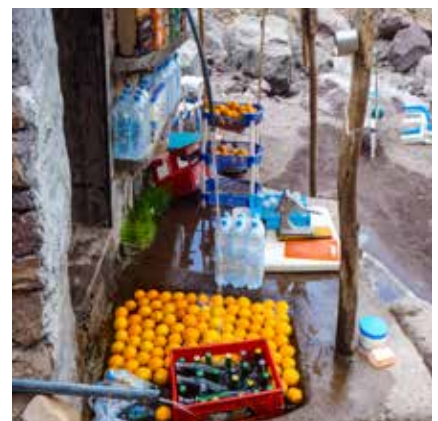
Kiosk bei Sidi Chamarouch