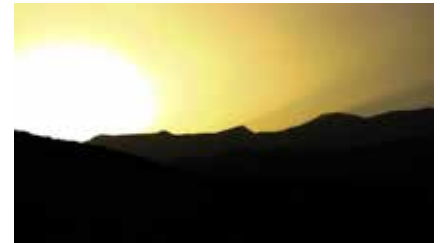
Sonnenuntergang in den marrokansichen Bergen