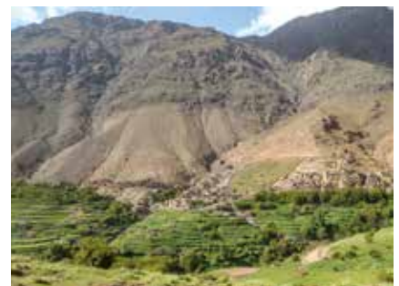
Das Dorf Tachdirt und seine terrassierten Felder