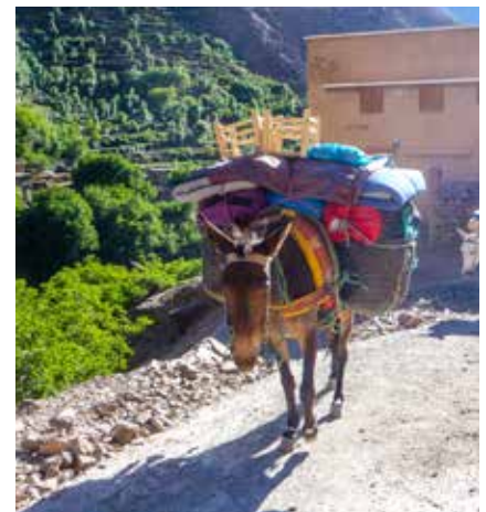
Die starken Helfer der Berber im Hohen Atlas