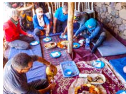
Tee-Zeremonie vor dem Mittagessen

Sie können bei den Geldwechselschaltern am Flughafen wechseln, in Marrakesch bleibt dafür aber auch noch ausreichend Zeit. In größeren Städten kann man auch am Bankomaten Geld beheben. Bitte prüfen Sie, ob Ihre Bankomatkarte fürs Ausland freigeschaltet ist (GeoControl). Der Kurs ist in ganz Marokko identisch.