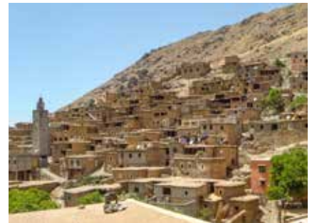
Das beeindruckende Dorf Ikkis