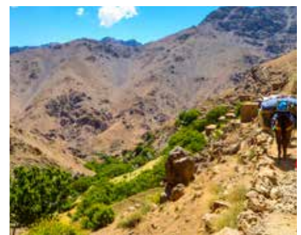
Üppiges Grün trifft auf wüstenhaften Charakter