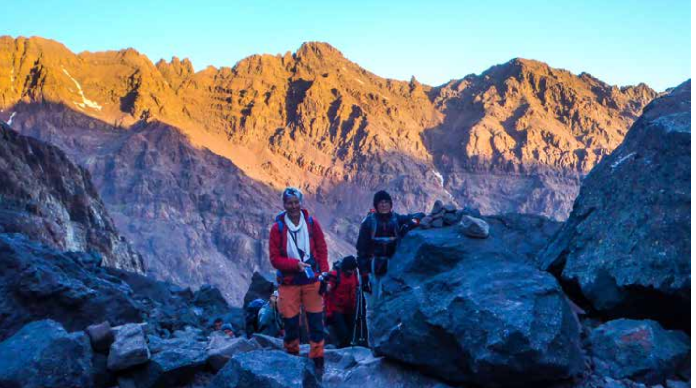
Sonnenaufgang beim Gipfelaufstieg am Djebel Toubkal