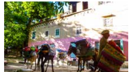
Das stattliche Dorf Amsouzert