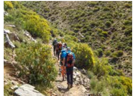
Richtung Tizi n'Aguersioual