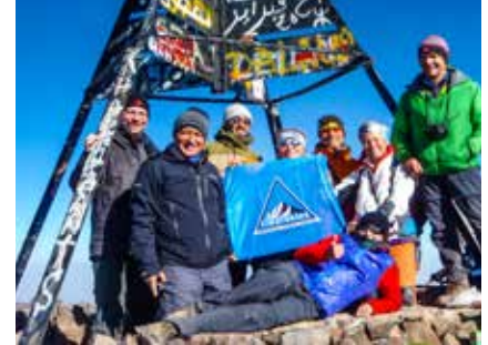
Am Gipfel des Djebel Toubkal