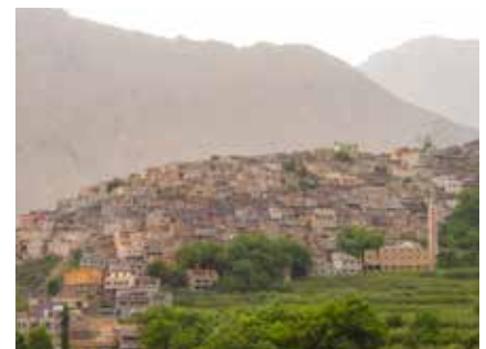
Abstieg nach Imlil

Kunden aus der Schweiz können unsere CHF-Kontoverbindung in der BTV Staad (Schweiz) spesenfrei nutzen.