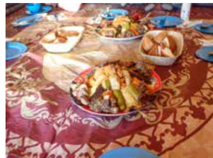
Mahlzeit im Berberzelt

Gezeiten von ca. 5 bis 7 Stunden am Tag, Auf- und Abstiege bis ca. 1200 Höhenmeter pro Tag, meist weniger. Einzelne Tagesetappen können auch etwas länger sein. Gute Kondition ist notwendig und wird vorausgesetzt.