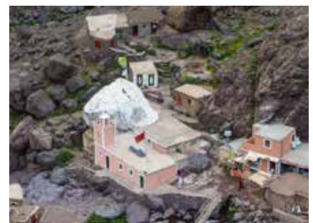
Der Wallfahrtsort Sidi Chamarouch