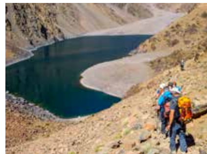
Am Weg zum See Ifni

In Marrakesch erwarten Sie um die 25°C. In der Wüste kann es untermittags heiß sein, aber speziell am Abend nach Sonnenuntergang wird es kalt werden. Denken Sie beim Packen daher an einen guten Sonnenschutz, aber auch an warme Kleidungsstücke (Handschuhe, Mütze, Thermo-Unterwäsche). Unsere Ausrüstungsliste liefert gute Tipps für das Reisegepäck.