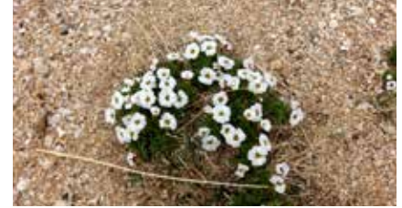
Die Blumenpracht entlang unseres Treks

Keine alpinen Schwierigkeiten, gute Trittsicherheit erforderlich. Unsere Tour verläuft größtenteils in weglosem Gelände ohne alpine Schwierigkeiten, teilweise auch auf schmalen Pfaden. Es müssen auch Passagen ohne Weg in steinigem Gelände zurückgelegt werden. Speziell an langen Tagesetappen ist in diesem Gelände große Konzentration und sicheres Gehen erforderlich.