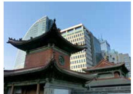
In der Hauptstadt Ulaanbaatar