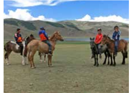
Eine weitere Wettkampfkategorie: das Pferderennen

Kreditkartenzahlung: Die Bezahlung Ihrer Reise mit Kreditkarte ist prinzipiell möglich. Bitte beachten Sie, dass hier teilweise Spesen entstehen können. Bitte kontaktieren Sie uns diesbezüglich telefonisch.