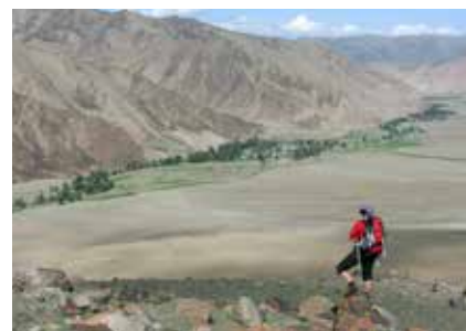
Das Bulgan Tal

Der Personalausweis genügt zur Einreise nicht. Der Reisepass muss bei Einreise noch mindestens 6 Monate gültig sein.