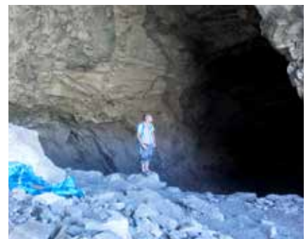
In der Tsenkher Höhle