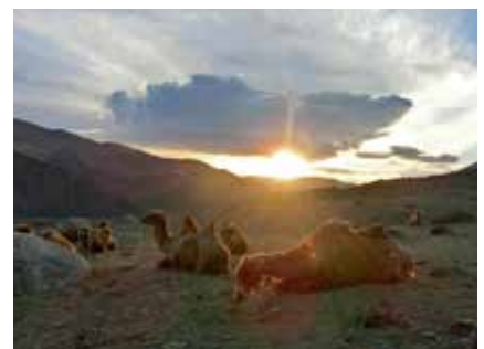
Unsere Begleiter bei einer verdienten Pause