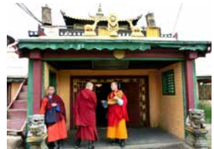
Mönche des Gandaan Kloster