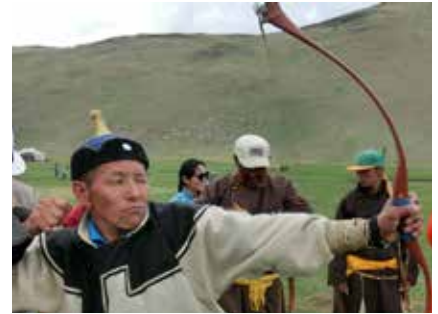
Bogenschütze bei den nomadischen Wettkämpfen