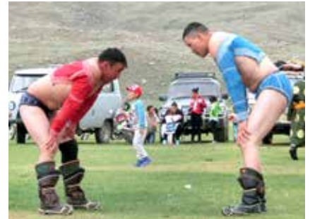
Ringer bei den Festspielen Nadaam