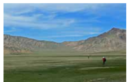
Die Weite der Mongolei