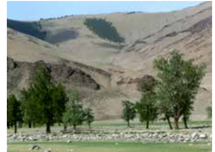
Im Bulgan Tal