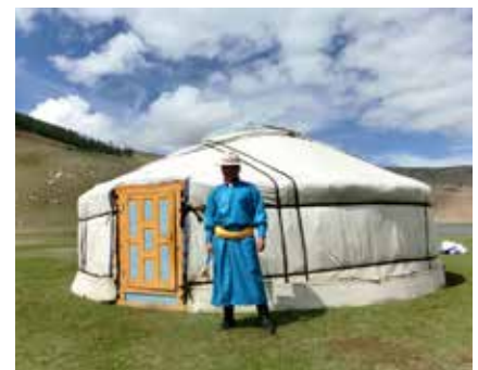
Ger - die mongolische Yurte