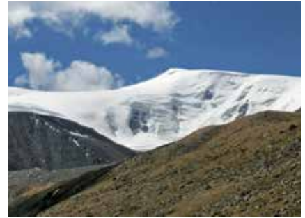
Der heilige Berg Munkh Khairkhan

Je nach Tagesetappe und Gegebenheiten kann dieser Zeitplan natürlich abweichen.