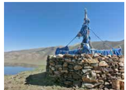
Ein Oboo - Zeuge des Schamanentums

Unter dem Einfluss der Sowjetunion wurden zahlreiche Tempel und Klöster zerstört und sämtliche Religionen verboten. Seit 1991 herrscht Religionsfreiheit, etwa die Hälfte der Bevölkerung ist buddhistisch, ansonsten gibt es christliche und islamische (unter den Turkvölkern) Minderheiten. Auch der Schamanismus ist immer noch verbreitet.