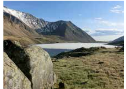
Blick vom Lagerplatz am Ikh Turgen See

Obwohl die mongolische Küche traditionell sehr fleischlastig ist, können wir vegetarische Verpflegung bieten. Bitte um entsprechenden Hinweis bei der Buchung.