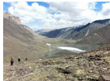
Im Shuurkhai Tal