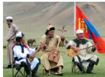
Bei Nadaam, den nomadischen Wettkämpfen