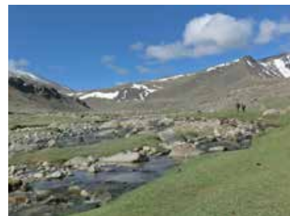
Der Shuurkai Pass

Für die Einreise in die Mongolei sind keine Impfungen vorgeschrieben. Empfehlenswert sind, wie bei den meisten Fernreisen, Impfungen gegen Tetanus, Diphtherie, Polio, Typhus und Hepatitis A und B. In die Reiseapotheke gehören jedenfalls Medikamente gegen Schmerzen, Durchfall, Antibiotika, Lotion gegen Insekten, Sonnenschutzmittel und Verbandszeug. Beachten Sie bitte, dass die medizinische Versorgung in der Mongolei nicht dem westlichen Standard entspricht und berücksichtigen Sie das bitte bei Ihrem Versicherungsschutz für die Reise. Bitte lassen Sie sich in jedem Fall von Ihrem Arzt beraten.