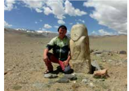
Unser mongolischer Begleiter mit Menschenstein