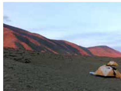
Unser Lager am Gurt Fluss bei Sonnenuntergang