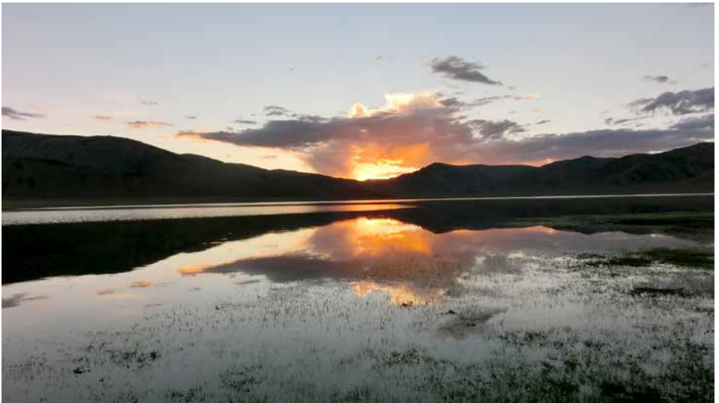
Am Seruun See