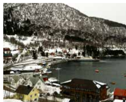
Blick auf Lyngseidet