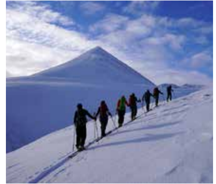
Skitour auf den Kvalvikfjellet

Die Mitnahme von Steigeisen und Haarscheisen sowie Erfahrung damit wird erwartet.