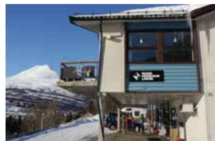
Magic Mountains Lodge in Lyngseidet

Im Norden von Norwegen bestehen auch im März noch gute Chancen, Nordlichter beobachten zu können. Die besten Voraussetzungen sind kaltes, trockenes Wetter und ein klarer Himmel!