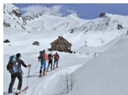
Auf dem Weg zur Johannishütte